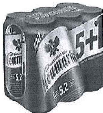
6x Can 0.5 L