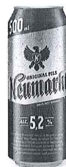
Can 0.5 L