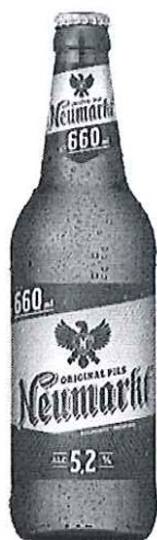
Sticla 0.66 L