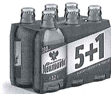
6x Sticla 0.33 L