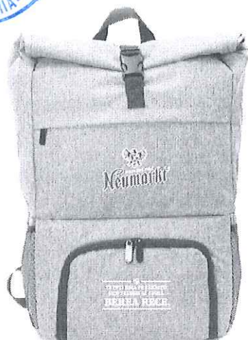
Rucsac personalizat Neumarkt®