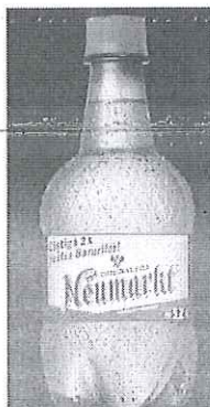
Pet 0.5 l