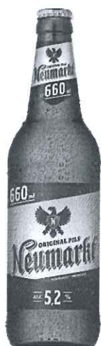
Sticla 0.66 L