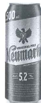
Can 0.5 L