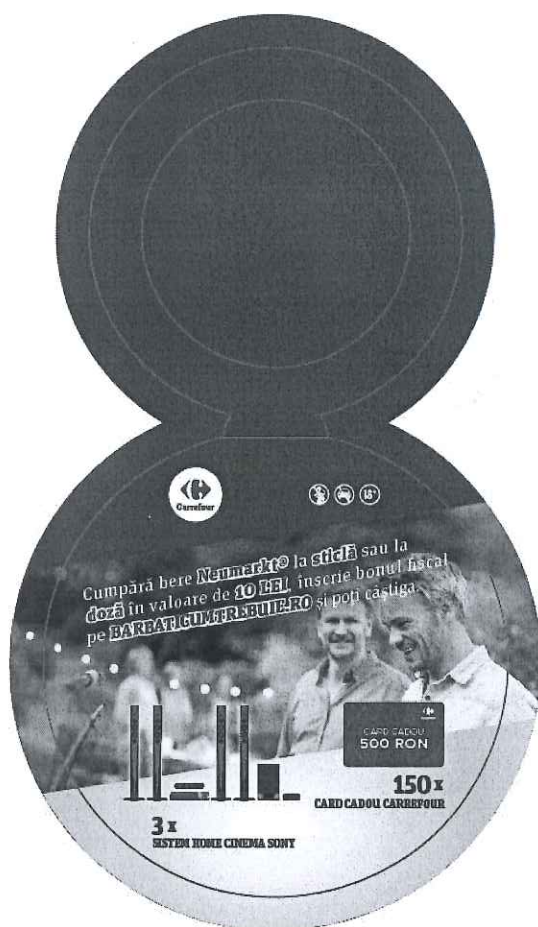
Neck hanger sticla fata