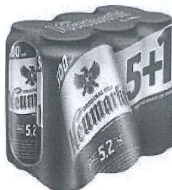
6x Can 0.5 L