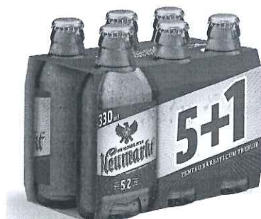
6x Sticla 0.33 L